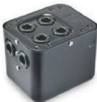
Transformador de ignición 444BT - 636

Transformador Allanson, de 120 voltios a 6000 Voltios, 60 Hz, 1 borne de salida frontal.