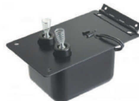
Transformador de ignición RF2721 - 605

Transformador Allanson universal, de 220 voltios a 10,000 Voltios, 60 Hz, 2 bornes.