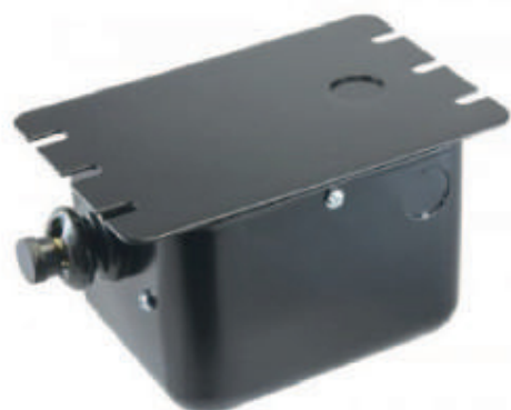
Transformador de ignición 1092 - S